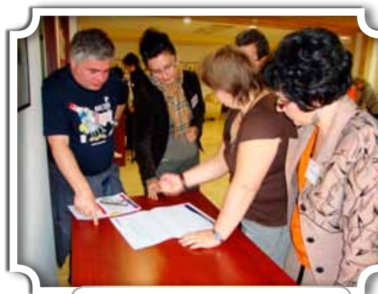
Aspect din timpul unui atelier de lucru