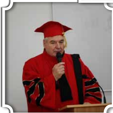
La decernarea titlului de Doctor Honoris Causa din partea Universității Danubius din Galați