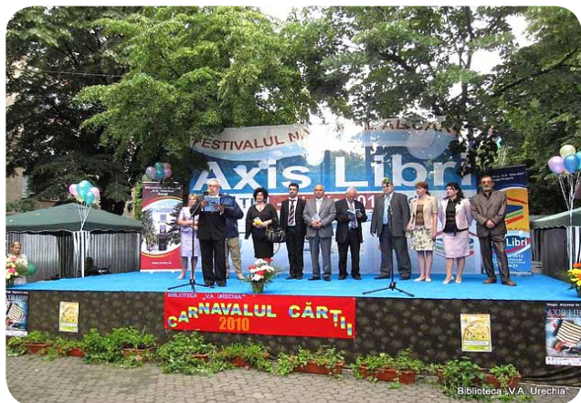
Deschiderea oficială a Festivalului, ediția 2010

genuri literare, lucrări de istorie, filosofie, politică, biblioteconomie și știința informării etc.